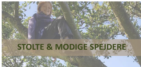
STOLTE & MODIGE SPEJDERE