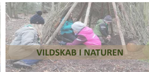
VILDSKAB I NATUREN